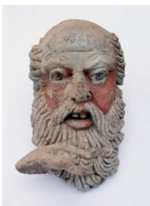
Testa di Nestore Tempio del Belvedere Orvieto

Nestore, re di Pilo e il più vecchio dei condottieri greci nella guerra di Troia, era famoso per il suo valore, il suo equilibrio e la sua saggezza. Ora ci accompagna nella fase della vita dopo il lavoro, densa di cambiamenti, alla ricerca di nuovi equilibri, nuove ragioni di vita e progetti per il futuro, nella prospettiva di un invecchiamento attivo.